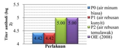
Gambar 4. Rataan hasil uji HI titer antibodi ND

Berdasarkan hasil uji HI, titer antibodi ND yang dihasilkan pada perlakuan temulawak tergolong cukup baik, sedangkan pada perlakuan kontrol dan kunyit masih di bawah standar antibodi protektif. Menurut OIE (2008), titer antibodi dikatakan protektif terhadap ND jika memiliki titer antibodi minimal 5 log 2.