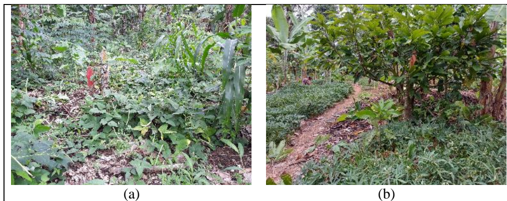
Gambar 2. Tanaman penutup tanah, (a) kacang tunggak dan jagung dan (b) ketela rambat

Sebagai perajin gula aren, maka pohon aren yang diusahakan cukup banyak yaitu 85 pohon per hektar dengan komposisi 11,8% pohon produktif, separuhnya sedang disadap, separuhnya sedang tidak ada tandan bunga jantan untuk. Sebanyak 28,2% merupakan pohon aren muda yaitu dalam pertumbuhan meninggi dan belum menghasilkan tandan bunga. Komposisi utama dari komunitas tanaman aren adalah anakan (belum berupa pohon) yaitu berjumlah 60%. Struktur komunitas pohon aren seperti ini dimaksudkan untuk menjamin ketersediaan dan seleksi pohon, serta keberlanjutan usaha pembuatan gula aren.