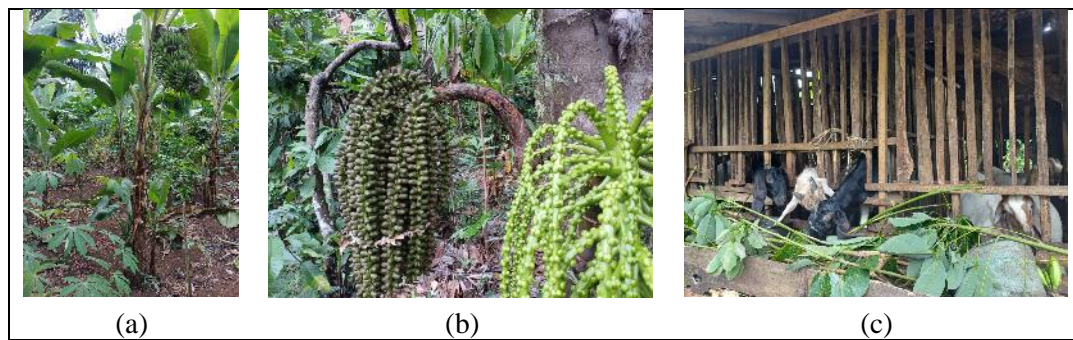
Gambar 3. Sumber produktif agroforestri muda, (a) pisang sebagai penabung sementara kakao/kopi, (b) penderasan aren, (c) kambing dengan pangkasan agroforestri sebagai pakan

Gambar 3 menyajikan sumber-sumber penerimaan di agroforestri kakao yang penting dalam penelitian ini. Penerimaan dari menjual kambing Pisang belum dicatat karena petani belum menjual kambing melainkan dalam tahap pengembangbiakan. Petani mengaku lebih menguntungkan ternak kambing pembibitan (reproduksi) daripada kambing penggemukan. Integrasi agroforestri dan ternak menjadi kearifan lokal petani di wilayah ini. Pakan kambing terutama diperoleh dari ramban pepohonan dalam agroforestri. Sebaliknya kotoran kambing dan urin dimanfaatkan untuk pemupukan tanaman atau dijual sebagai sumber pendapatan. Pisang merupakan tanaman penabung produktif sejak awal perkembangan agroforestri kakao, dan berlanjut sebagai sumber pendapatan dan ketahanan pangan yang penting. Pohon aren dikelola dalam jumlah pohon produktif berkisar 5 pohon sesuai dengan kemampuan tenaga penderes. Sistem integrasi kambing dalam sistem agroforestri yang langsung berkandang di kebun, memanfaatkan hijauan agroforestri.