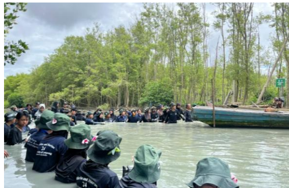
Gambar 1. Peserta Penanaman Mangrove

Fisheries and Marine Conservation (Fic) , merupakan kegiatan pengabdian kepada masyarakat. Program ini melibatkan Mahasiswa/I Universitas Lampung, Khususnya Perikanan dan Kelautan, beserta warga desa tempat diadakannya kegiatan. Agenda ini berisi kegiatan konservasi, yang mana hal umum dilakukan adalah penanaman mangrove. Penanaman mangrove dilakukan di Desa Purworejo, Kecamatan Pasir Sakti, Kabupaten Lampung Timur, dengan mangrove yang digunakan berjenis Rizophora sp. sejumlah 2024 bibit. Sesuai dengan tema yang dibawakan yaitu “ Improving Sustainable Ecosystem Through Mangrove Reforestation ” atau Meningkatkan Ekosistem Berkelanjutan Melalui Reboisasi Mangrove. Harapannya kegiatan penghijauan ini dapat berdampak terhadap ekosistem hingga masyarakat sekitar.