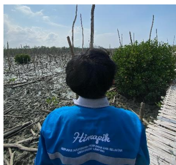
Gambar 2. Lokasi Hutan mangrove gundul

Menurut Permen LHK No 105 Tahun 2018, reboisasi merupakan upaya penanaman jenis pohon hutan pada kawasan hutan rusak yang berupa lahan kosong, alang-alang atau semak belukar untuk mengembalikan fungsi hutan.