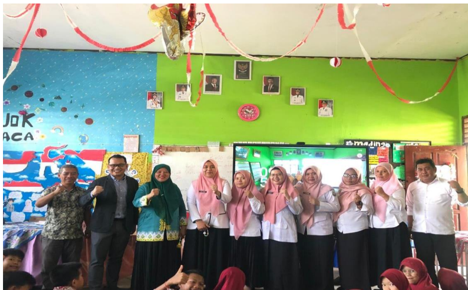
Gambar 4. Foto bersama para guru SDN 2 Bukit Kemiling Permai

Pelestarian hutan dan lahan, dilakukan dengan berbagai cara, seperti pengelolaan hutan secara berkelanjutan, pemulihan area hutan yang tercemar, serta penerapan metode tebang pilih dan penanaman kembali tanaman di habitat aslinya. Selain itu, peran masyarakat sangat penting dalam upaya pelestarian hutan secara berkelanjutan, karena mereka memiliki pengetahuan yang bisa digunakan untuk menjaga kondisi hutan tersebut. Gerakan rehabilitasi hutan dan lahan merupakan bagian dari komitmen pemerintah dalam menghadapi kerusakan hutan (Anto et al., 2024). Kegiatan terakhir dalam kegiatan ini yaitu foto bersama (Gambar 4 dan Gambar 5.)