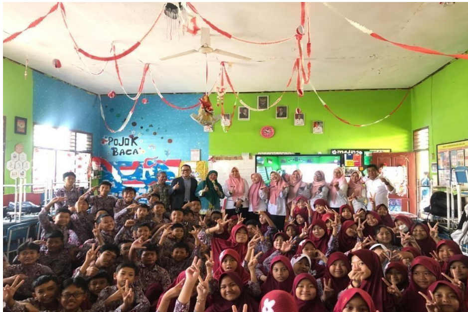
Gambar 5. Foto bersama para siswa SDN 2 Bukit Kemiling Permai.